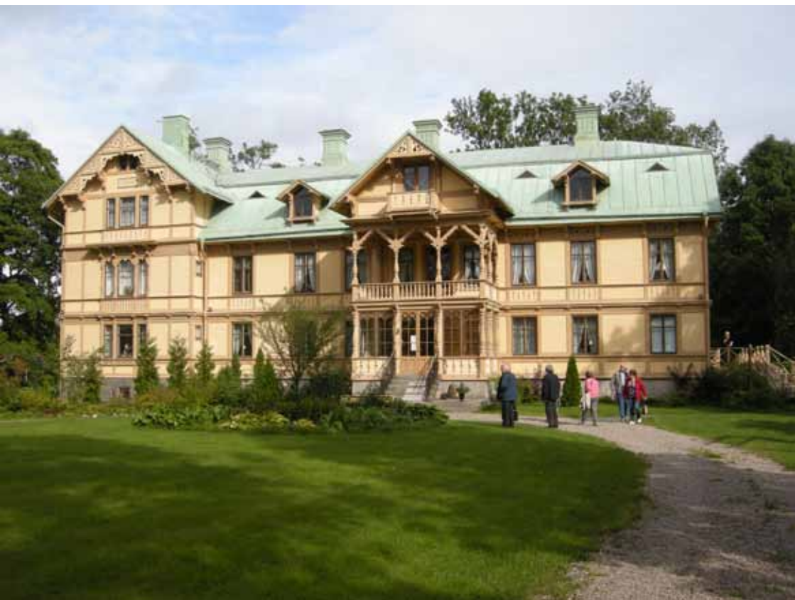
Resedeltagare vid Långvinds herrgård.